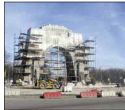
Плата за Арку