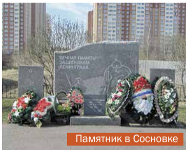
Памятник в Сосновке

Надо отметить, что памятных мест, посвящённых подвигу защитников родины в годы Великой Отечественной войны, на территории Красносельского района довольно много: 17 памятников, мемориалов и братских захоронений, 3 храма-памятника и 21 памятная доска. Из них 6 памятников и 4 памятных доски - в Красном Селе, 4 памятника, один храм-памятник и одна памятная доска - в Горелово.