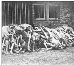
Фабрика смерти глазами ветерана