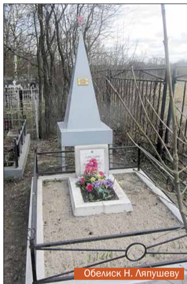
Обелиск Н. Ляпушеву