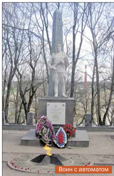
Воин с автоматом

Из 10 военных памятников, расположенных в Красном Селе и Горелово, лишь половина содержится на бюджетные деньги.